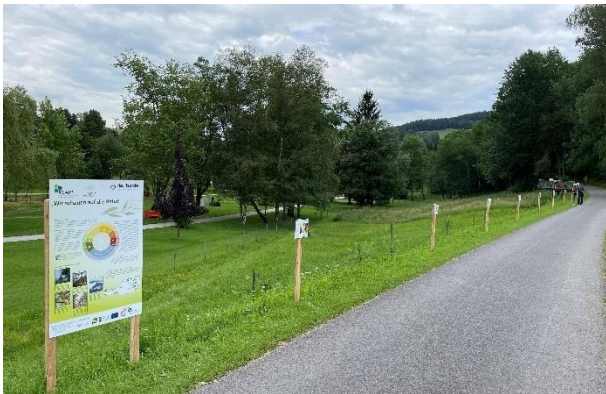
Naturkalender Gehweg Kurpark vom Spielplatz Richtung Gasthaus Koder

KLAR! ist ein Programm des Klima- und Energiefonds mit dem Ziel, Regionen und Gemeinden die Möglichkeit zu geben, sich auf den Klimawandel vorzubereiten und mittels Anpassungsmaßnahmen die negativen Folgen des Klimawandels zu minimieren und die sich eröffnenden Chancen zu nutzen.