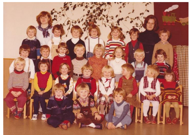
1. Kindergartenjahr 1979/1980

Ich wünsche dem neuen bzw. alten Kindergarten-Team alles erdenklich Gute und viel Freude bei der Arbeit.