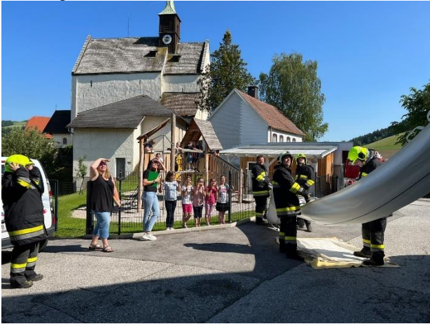
Einsatz des Rettungsschlauches

Außerdem wurde auch der Rettungsschlauch aufgebaut und damit die Rettung der Kinder aus dem Gebäude geübt.