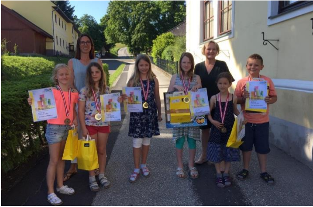
Foto: die SiegerInnen der 3. und 4. Schulstufe

Wir gratulieren allen SchülerInnen zu ihren tollen Kunstwerken!