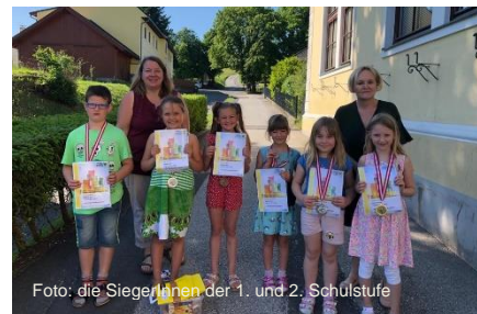
Foto: die SiegerInnen der 1. und 2. Schulstufe

Im Zeitraum 04.01. bis 31.03.2021 fand der alljährliche Raiffeisen