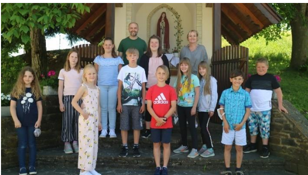
Foto: die SchülerInnen der 4. Schulstufe

In diesem Schuljahr haben die Schülerinnen und Schüler der 4. Klasse trotz einiger Einschränkungen aufgrund der Pandemie viel gelernt. Das Verfassen von langen Texten und das Rechnen im Millionenraum waren die wichtigsten neuen Themenbereiche. Im Sachunterricht konnten die Kinder viel über unsere Gemeinde und unser Bundesland entdecken. Besondere Highlights im Schuljahr waren der Besuch des Gemeindeamtes, die Teilnahme am Bolyai-Wettbewerb und der Radfahrführerschein.