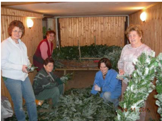
Das Team das seit 20 Jahren den großen Adventkranz für den Dorfplatz anfertigt.

Auch heuer wurde die Nikolausfeier wie jedes Jahr von vielen Gästen besucht. Auch dem Kindergarten wurden die Nikolaussäckchen für ihre Feier vom Verein gespendet.